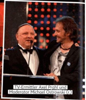
TV-Ermittler Axel Prahl und Moderator Michael Ostrowski (r)