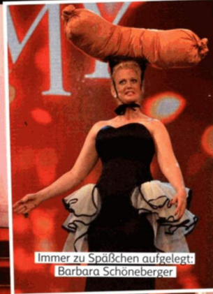
Immer zu Spaßchen aufgelegt: Barbara Schöneberger