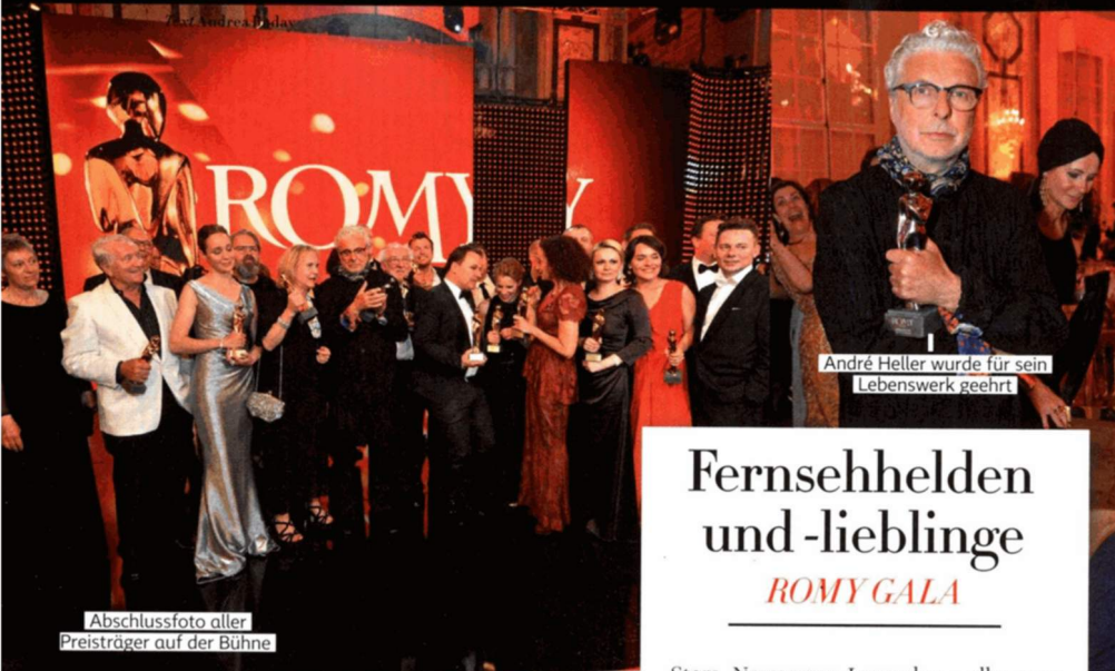
Abschlussfoto aller Preisträger auf der Bühne

Von Vernissagen bis zu Gala-Abenden – wienlive war dabei!