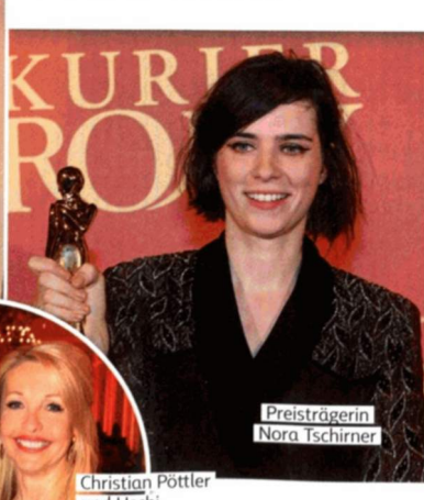
Preisträgerin Nora Tschirner