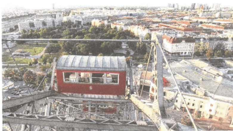
Ausblick auf die wunderbare Stadt vom Riesenrad am Wiener Prater.