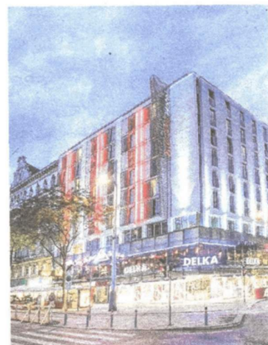
InterCityHotel an der Mariahilfer Straße.