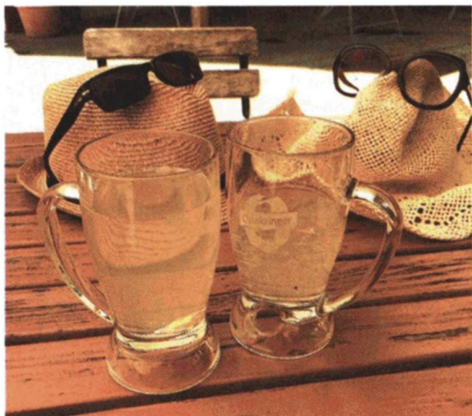
PROST | Mit der richtigen Portion Humor lebt es sich leichter. Das sieht auch Fotograf Christoph Bathelt so.