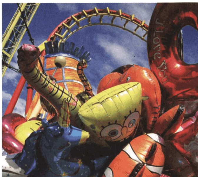
VERGNÜGEN | Die Achterbahn im Hintergrund, eine bunte Sammlung Ballons im Vordergrund. So sieht Friedrich Bartuschka den Prater.

Anfragen für weitere Nutzungsrechte an den Verlag