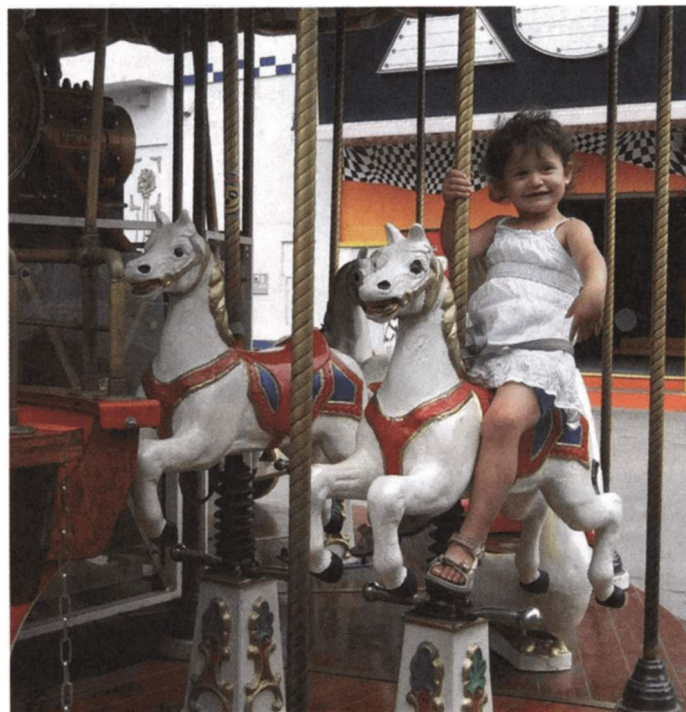
SPASS | Am schönsten ist es doch am Ringelspiel. Das entzückende Bild dieser jungen Dame wurde von Sylvia Marchart beigesteuert.