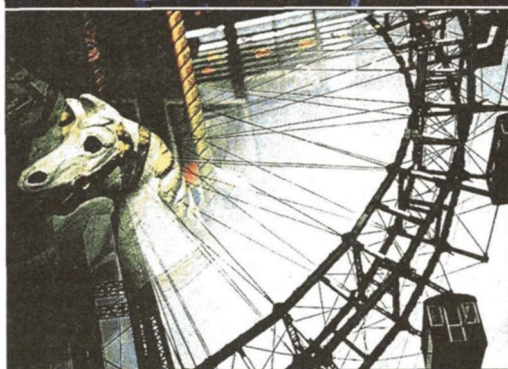
Mit der Lomo im Prater: Die Unschärfe ist Absicht