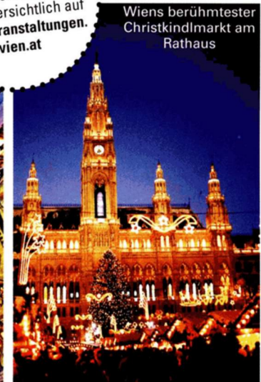
Wiens berühmtester Christkindlmarkt am Rathaus

Reinklicken lohnt sich immer: Alle Events deiner Stadt übersichtlich auf www.veranstaltungen.wien.at