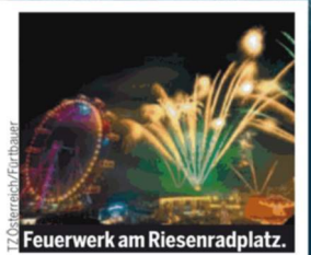
Feuerwerk am Riesenradplatz.

die App „Orundo Vienna“ auf ihr Handy herunterladen. Eine Countdown-Uhr zählt auf dem Smartphone die Zeit bis Mitternacht herunter und um 00:00 Uhr startet das Display mit einem prachtvollen Feuerwerk, begleitet vom berühmten Donauwalzer. Programm. Die App „Orundo Vienna“ gibt auch Auskunft über das Programm des Silvesterpfads.