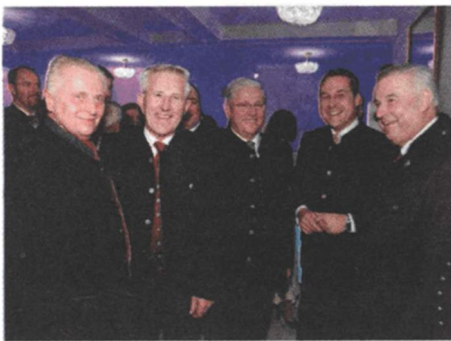
Politisches Halali: Hundstorfer links, Strache & Schützenhöfer rechts

Der größte Charity-Ball der Stadt ist ... der Life-Ball findet heuer nicht statt, und deshalb ist es ... der Jägerball! Den hat der Verein „Grünes Kreuz“ dieses Jahr zum 95. Mal veranstaltet. Da wurden der Hofburg zumindest ein wenig andere Traditionen gezeigt als eine Woche später beim Akademikerball. Der Eintritt machte 130 Euro, ein Sitzplatz dazu um die 60. Der Erlös geht traditionell an in Not geratene Jäger. Unter den 6600 Gästen war bei