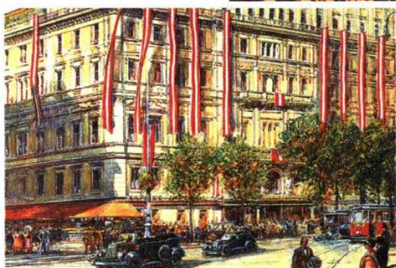
Das Hotel Imperial – eben in die Arab. Emirate verkauft – in Lebensräume , der neuen kulturgeschichtlichen Reihe

Österreichs Symbole stehen heuer im Fokus. Der Prater ist seit 250 Jahren für jedermann zugänglich – und deshalb Thema in der dienstäglichen ORF III-Reihe Mythos Geschichte . Andere Wahrzeichen des Landes werden in der Reihe Lebensräume porträtiert – per intimem Blick hinter die Kulissen