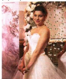
Heiraten in Österreich am Themenmontag, die Babenberger (re.) in Mythos Geschichte