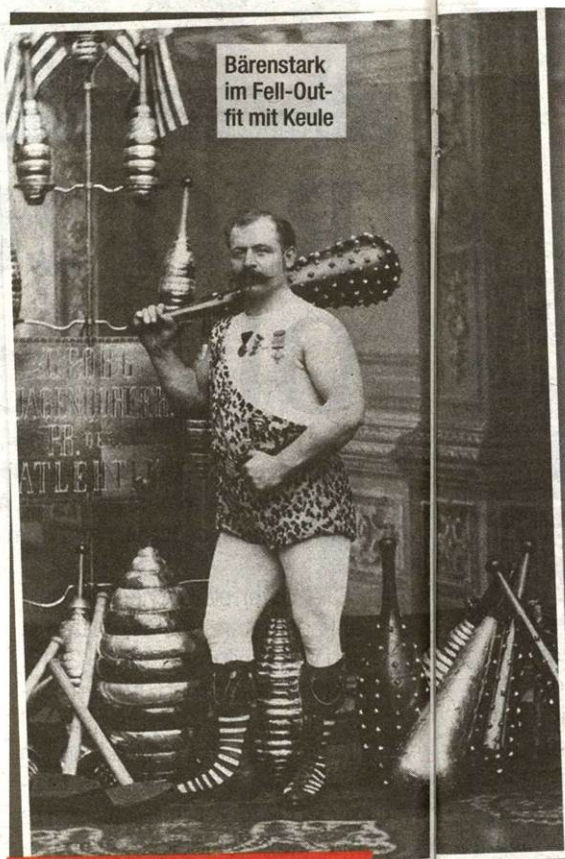
Bärenstark im Fell-Out- fit mit Keule