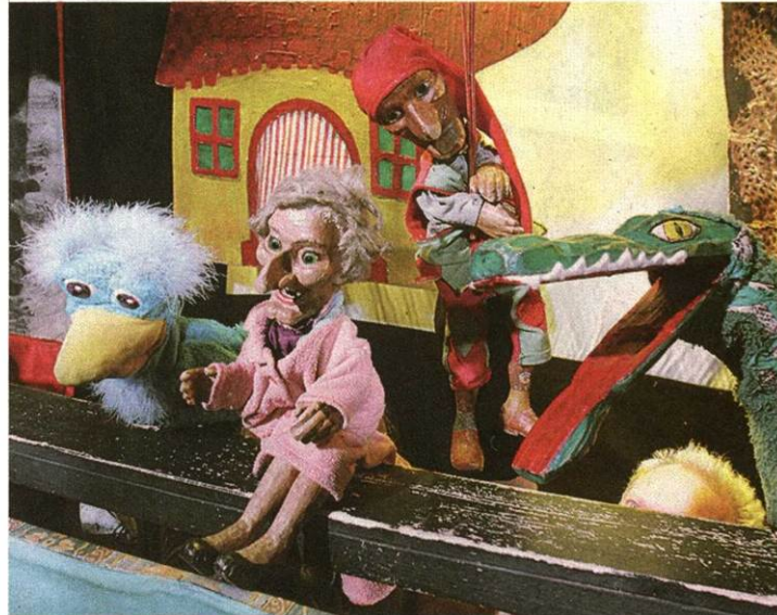
Helden der Kindheit: Es hat in Wien Tradition, dass das Krokodil böse ist und daher vom braven Kasperl mit dem Pracker bestraft werden muss

niert als die vom Praterkasperl. Selten gewinnen die Guten.