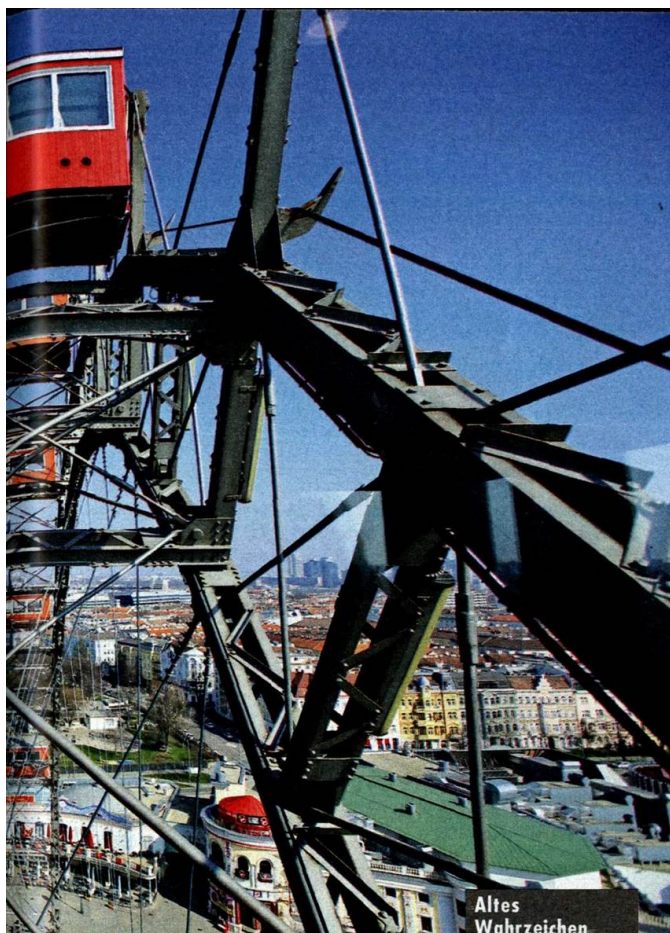
Altes Wahrzeichen von Wien: das Riesenrad mit seinen neuen Waggons.