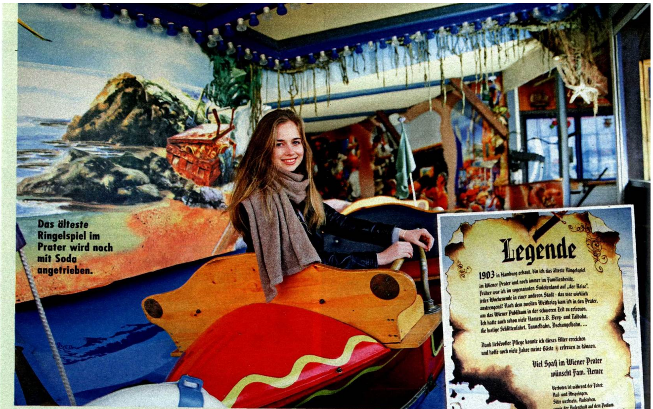
Das älteste Ringelspiel im Prater wird noch mit Soda angetrieben.