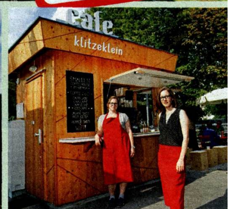
Fährt seit 1928: die Liliputbahn (ganz oben). Zu Besuch im Café Klitzeklein, das im Design einer Würstelbude aus Holz nachempfunden ist. Schön ist so ein Ringelspiel . . .

Anfragen für weitere Nutzungsrechte an den Verlag