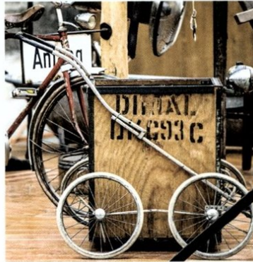
... Die Figuren bestehen ausnahmslos ...