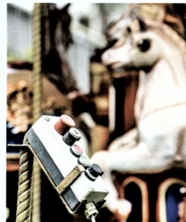
... genügt beim Ringenspiel (noch) eine einfache Technik.

„Herrreinspaziert! Herrreinspaziert!“ Die Stimme des Schaustellers scheppert aus dem Lautsprecher. Es riecht nach Langos und Zuckerwatte.