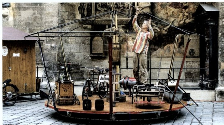
Angetrieben wird das Karussell über zwei Fahrräder, die vom Publikum in Schwung gebracht werden dürfen.

Beim Kettenflieger oder Kettenkarussell sind die einzelnen Sitze mit Ketten an einem Drehkranz aufgehängt. Je schneller