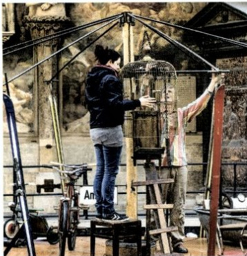
Karussell der Fundgegenstände: ...