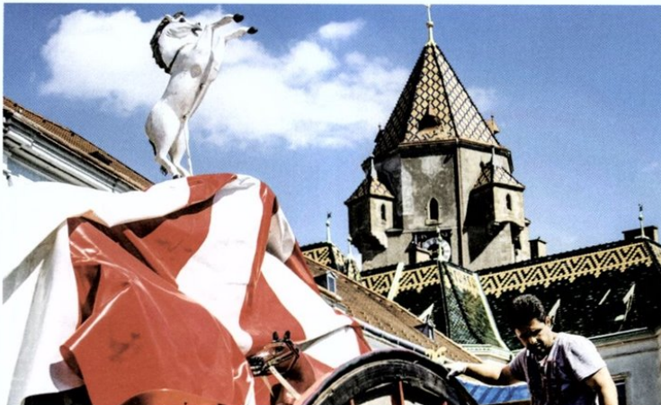
Kirtag in Korneuburg. Während große Fahrgeschäfte computergestützt betrieben werden ...