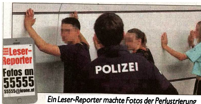
Ein Leser-Reporter machte Fotos der Perlustrierung

ben sofort zu, dass sie das Gewehr beim Stand 18A im Prater haben mitgehen lassen. Das „Souvenir“ wurde sichergestellt, und die fünf deutschen Schüler wurden ihren verständigten Lehrern übergeben.