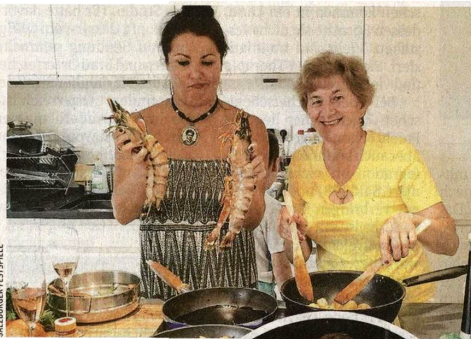
Spaßvogel: Netrebko liebt es, privat mit Freunden zu kochen