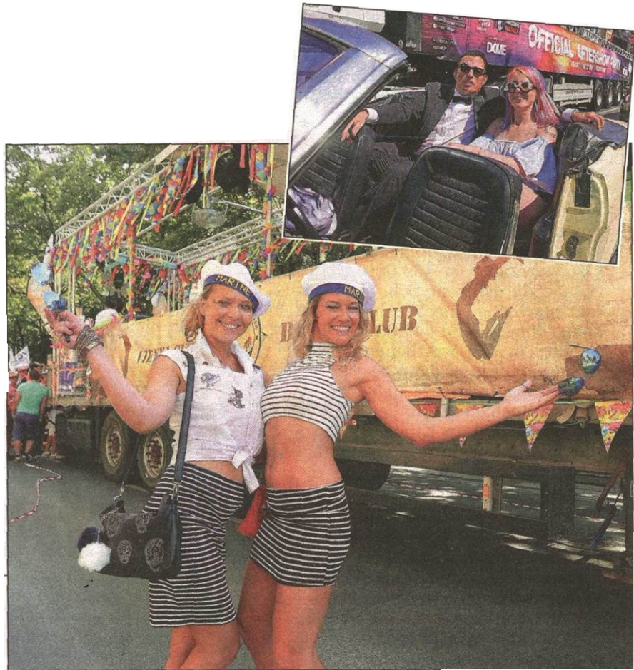
Die Partyfans zogen durch die Innenstadt. Motto des Festes: „Rette deinen Club“.