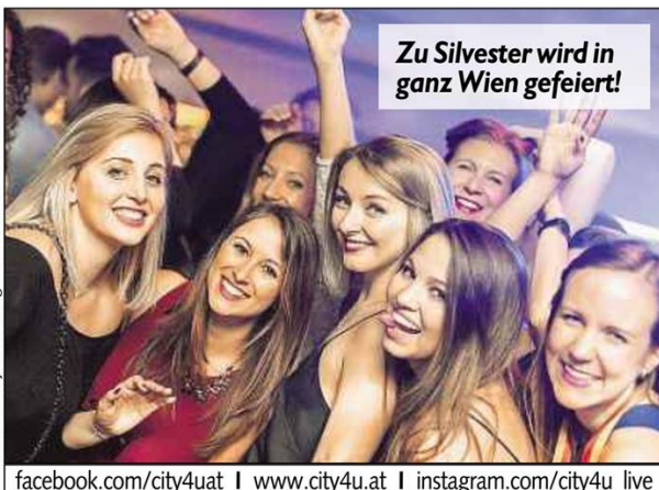
Zu Silvester wird in ganz Wien gefeiert!