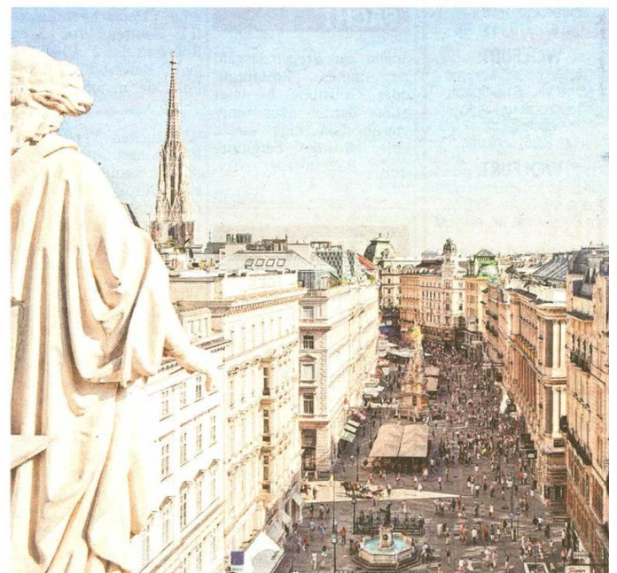
Die unzähligen Einkaufsmöglichkeiten locken die Besucher in den 1. Bezirk.