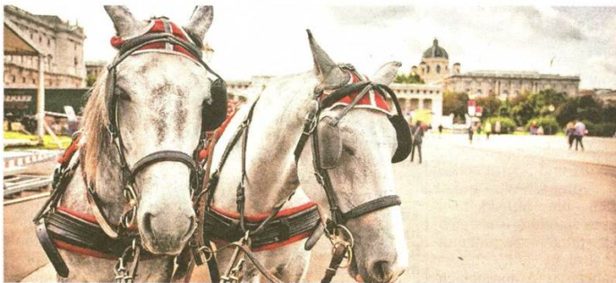
Die Fahrt mit dem Fiaker ist für jeden Besucher ein Muss.