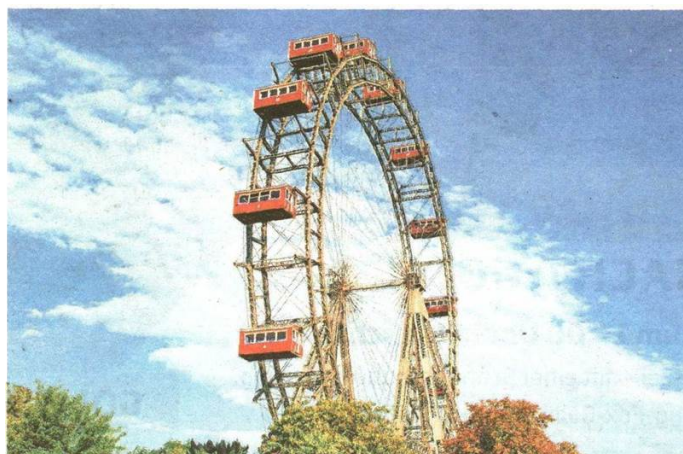
Seit 120 Jahren ist das Riesenrad im Prater eines der beliebtesten Wahrzeichen.