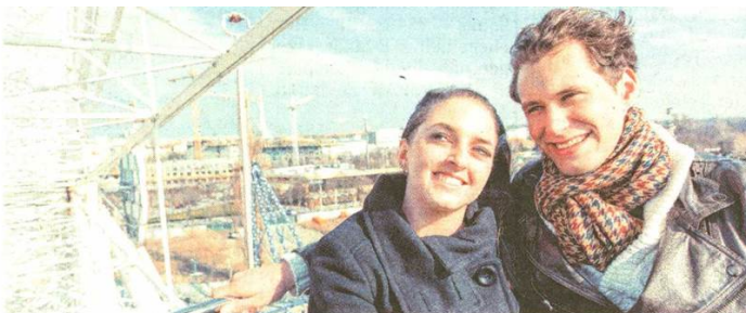
Herrlicher Blick über die Dächer Wiens.