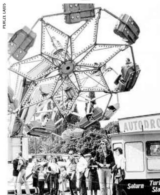
Die 80er: Krampfhaftes Versuche zu unterhalten