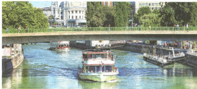
Bei einem Bootstrip auf der Donau kann man richtig entspannen.