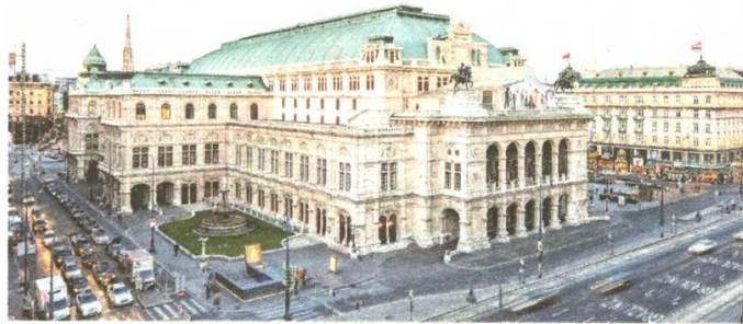
Die Wiener Staatsoper zählt zu den bekanntesten Opernhäuser der Welt.

Mit dem aktuellen Special von High Life Reisen kommt man ganz günstig und ganz bequem ab Altenrhein nach Wien. Man kann aus bis zu vier Flugverbindungen täglich auswählen und das Maximum aus der Städtereise heraus holen. Der Parkplatz am Flughafen Altenrhein ist in allen Pauschalpreisen inkludiert.