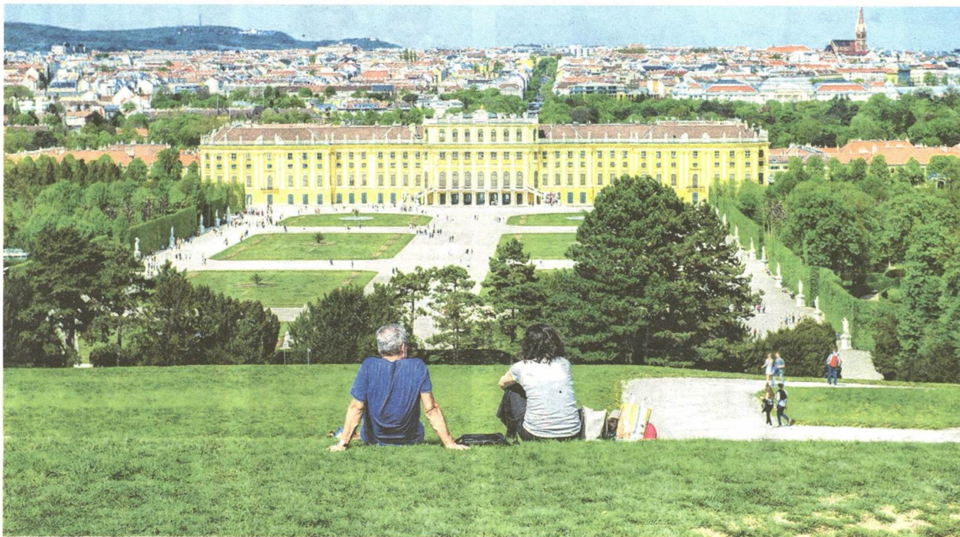
Das untrennbar mit Wiens Vergangenheit als Kaiserstadt verbundene Schloss Schönbrunn ist eines der schönsten Beispiele für barocke Architektur in Wien.