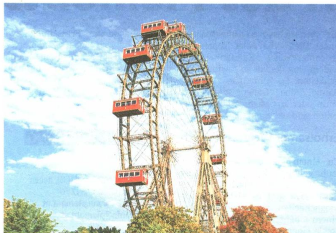
Das Riesenrad im Prater ist ein absolutes Must-See in Wien.