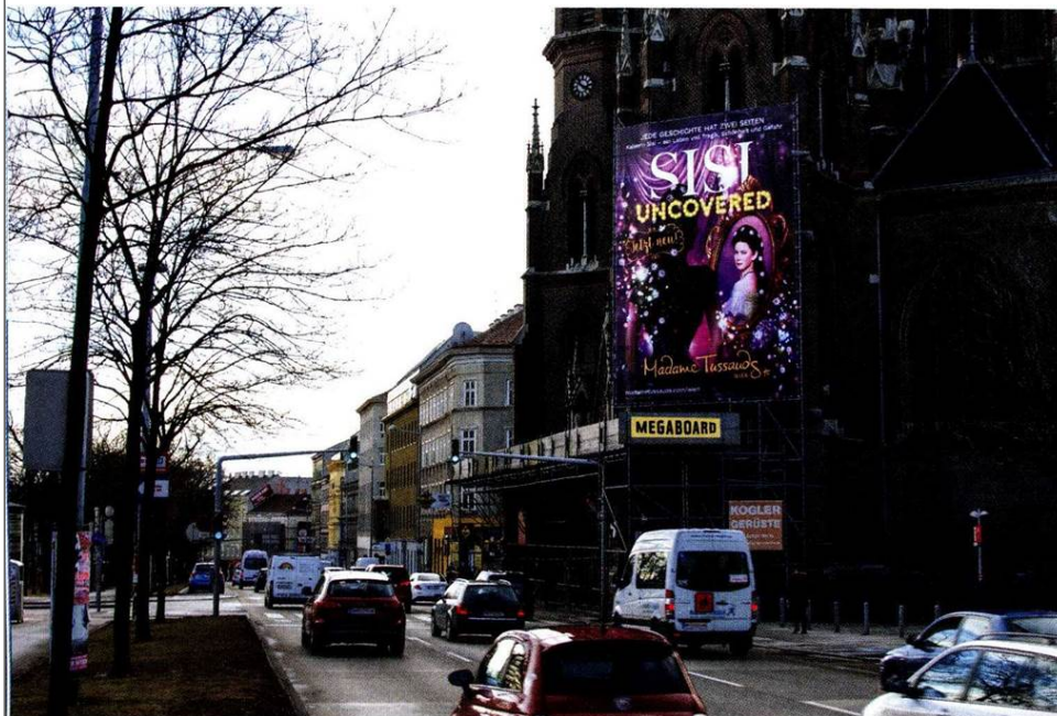
Madame Tussauds am Mariabilfer Gürtel