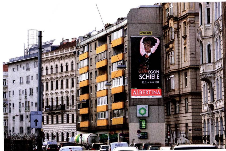
Albertina an der Wienzeile