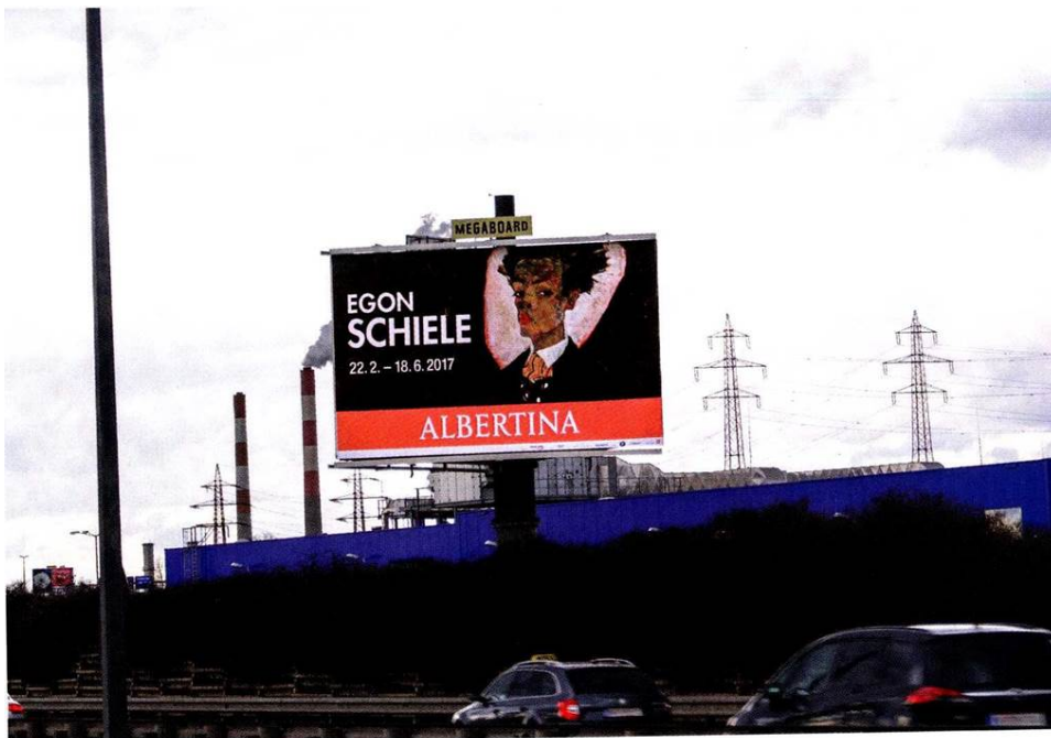
Albertina an der Flughafen-Autobahn Wien

Auch bei der Wiener Dependance von Madame Tussauds dürfen seit Jahren MEGABOARDS auf dem Weg zu ihrer Attraktion im Prater nicht fehlen. Um die Aufmerksamkeit zu steigern, setzen sie gekonnt Formatsprengungen ein. „Immer mehr Kunden schwören auf Extensions und bestätigen uns, dass das bei ihren Besuchern und Kunden gut