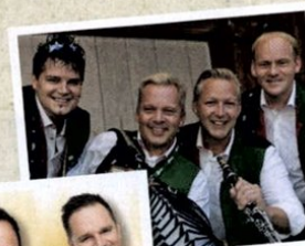
Dabei: DIE EDLSEER