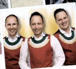
Fix: DIE JUNGEN ZILLERTALER