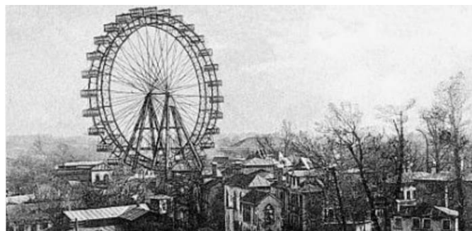
Das Wiener Riesenrad wurde im Sommer 1897 eröffnet

Anfragen für weitere Nutzungsrechte an den Verlag