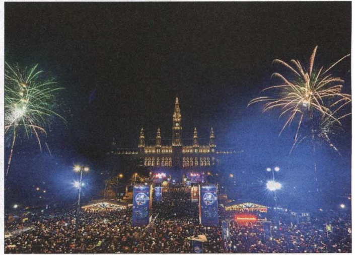
Der Wiener Eisraum und der Silvesterpfad sind die Highlights im Wiener Veranstaltungskalender rund um den Jahreswechsel.