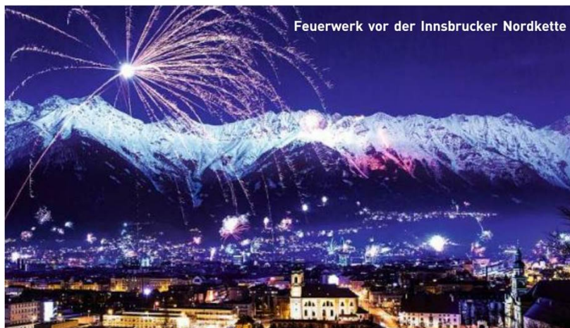
Feuerwerk vor der Innsbrucker Nordkette

Um 12.20, Seepromenade, Pertisau 82, www.tirol.at