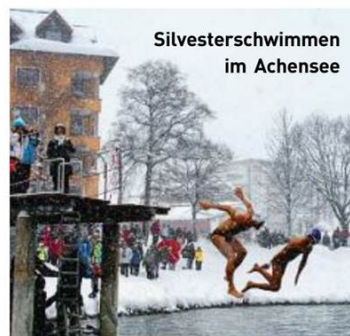
Silvesterschwimmen im Achensee