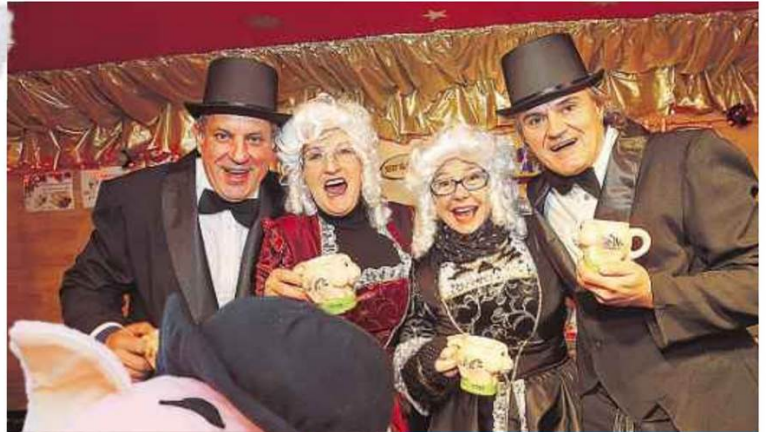
In der Wiener City wartet wieder ein buntes Programm.