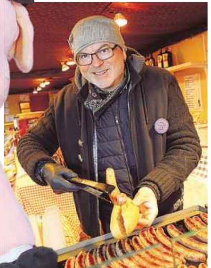
Kulinarische Schmankerln an jeder Ecke der Stadt.