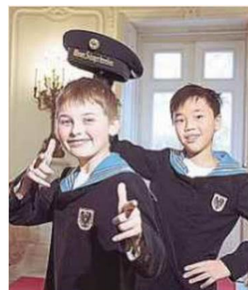
Das Red Bull Music Festival vereint Acts von den Wiener Sängerknaben bis Nazar.