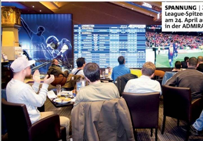
SPANNUNG | Zwei Champions-League-Spitzen-teams krachen am 24. April aufeinander – live in der ADMIRAL Arena Prater.