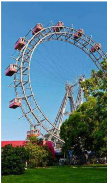
Runde Sache: Nach dem Picknick eine Fahrt mit dem Riesenrad

besten in den Wiener Prater. Viele Liegewiesen laden zum Verweilen ein. Vor- oder nachher mit der Hochschiessbahn oder Riesenrad fahren – oder beim Heustadlwasser ein Tretboot mieten und am Wasser picknicken.