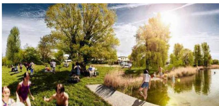
Pappeln und Weiden spenden Schatten in der Strombucht, die heuer in die dritte Saison geht. Hier gibt es Gratis-Baden und Picknickspaß in einem

Mit dem Picknicken kann man gar nicht früh genug beginnen. Deshalb haben wir schon einmal die besten Plätze in Wien ausgesucht. Am Wasser, unter Tieren oder mitten in der City – bei diesen Tipps ist für jeden etwas dabei. Damit der Spaß im Grünen noch größer wird, gibt es hilfreiche Accessoires fürs Outdoor-Vergnügen. von barbara stieger