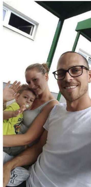
Markus Drakslers Familienausflug.