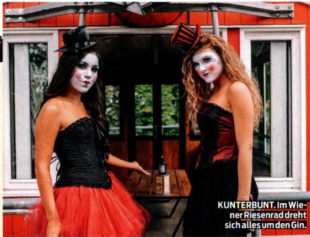
KUNTERBUNT. Im Wiener Riesenrad dreht sich alles um den Gin.

LOSTER: Der wunderbare Monkey 47 Schwarzwald Dry Gin zieht in einen der Waggons ein: Aus der Nummer 4 wird die Nummer 47. Die charakteristische Affen-Tapete wird die Wände zieren, im Innenraum entsteht ein sensorisches Erlebnis, das jeweils zehn Gäste mit auf eine Reise (Anm.: Dauer eine Fahrt) in den Schwarzwald nimmt. Hoch über Wien genießen die Besucher einen vom Barkeeper des Waggons gemixten Monkey Tonic.