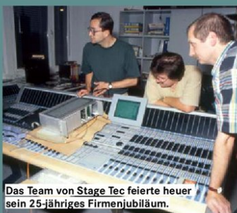
Das Team von Stage Tec feierte heuer sein 25-jähriges Firmenjubiläum.