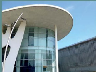
Die ISE wird ab 2021 in der Gran Via (Barcelona) stattfinden – in acht Hallen und auf rund 200.000 m² Ausstellungsfläche.

BARCELONA Die bis zum Jahr 2020 im Amsterdamer Veranstaltungszentrum RAI stattfindende weltweit größte Ausstellung rund um die Themen Audiovision und Systems Integration, die Integrated Systems Europe (ISE), findet ab dem Jahr 2021 in Barcelona statt. Grund dafür ist die begrenzte Fläche, die dem kontinuierlichen Wachstum der Messe zukünftig nicht mehr Rechnung tragen kann. Neuer Veranstaltungsort wird daher die Fira de Barcelona sein, eines der größten und prestigeträchtigsten Veranstaltungszentren Europas. www.iseurope.org