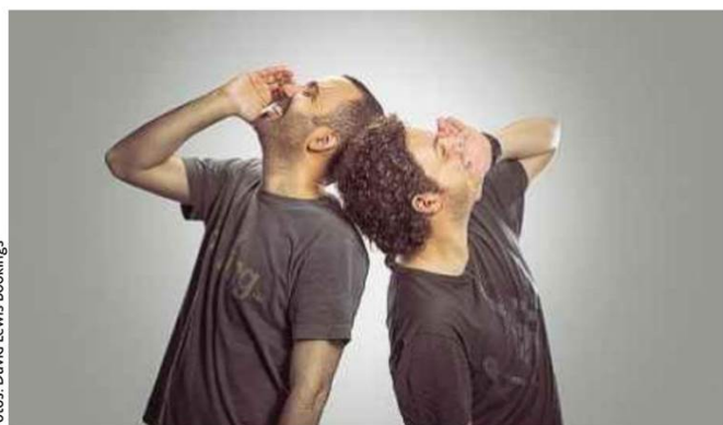
Das DJ-Duo Vini Vici kommt am 1. Dezember nach Wien