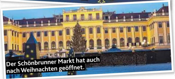
Der Schönbrunner Markt hat auch nach Weihnachten geöffnet.