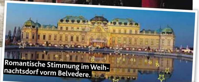
Romantische Stimmung im Weihnachtsdorf vorm Belvedere.