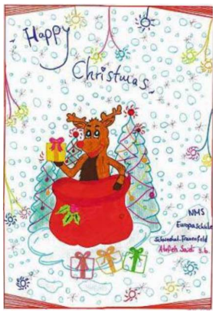
SAIDI ATEFEH, NMS Europaschule, 3b