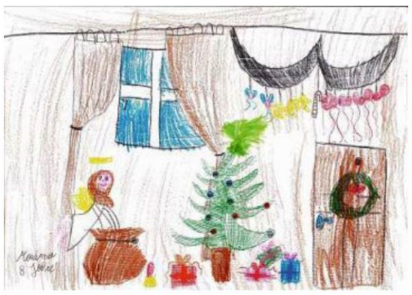
MAXIMA STORM 8 Jahre