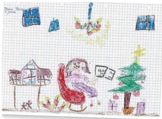
THERESA FLICKER 6 Jahre