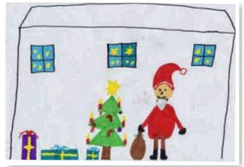
ZOE WIESNER Volksschule Alterlaa, 4c