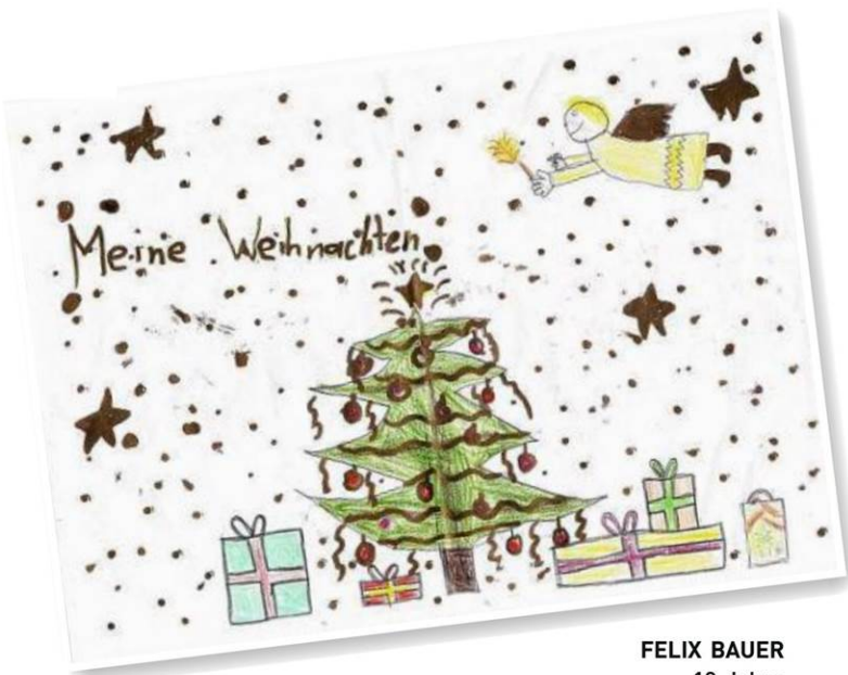
FELIX BAUER 10 Jahre