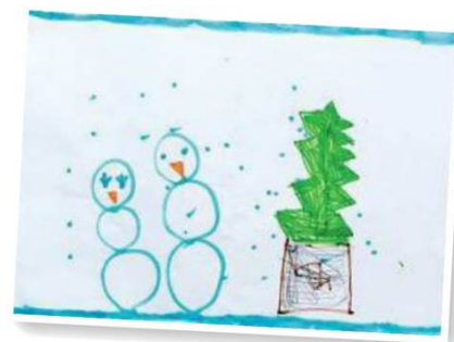
ADELE JUEN 4 Jahre