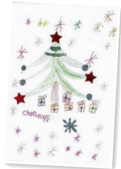
CHELSEA SCHMELZER 6 Jahre