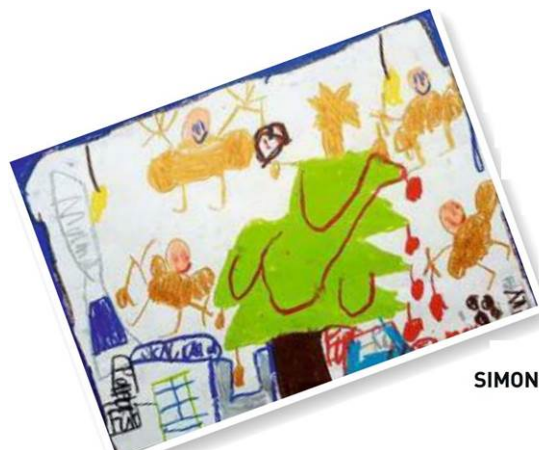
SIMON LUXL, 7 Jahre