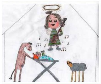
NADINE PAP, 9 Jahre

INFO: 24.12., Hauptplatz, 10 bis 14 Uhr, www.eisenstadt.gv.at