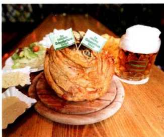
Eine Stelze im Schweizerhaus zählt ebenso zu den Highlights wie die neuen Attraktionen im Wurstelprater.

Hauptsaison: 15. 3. – 31. 10. Täglich geöffnet, freier Eintritt! pratercard.at (Karten, Rabatte) prateraktiv.at (Infos, Events, News)