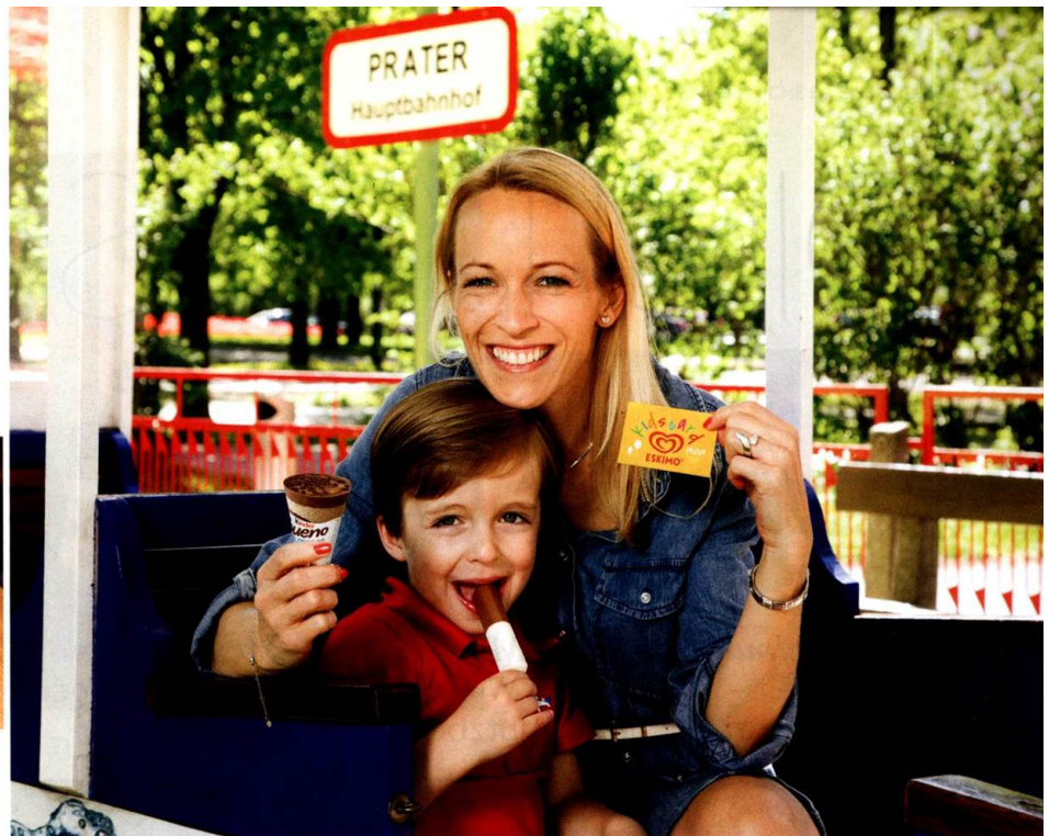
Die „Kids Card“ und die „Kids +1 Card“ sorgen bei Besuchern ab drei bzw. vier Jahren für ein tolles Praterabenteuer.

Endlich. Ab 15. März hat Wiens legendäre Institution wieder Saison.