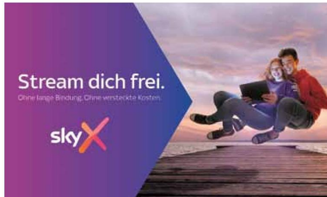
Für die Bewerbung des neuen Produkts Sky X gibt es für Österreich die größte je gelaunchte Kampagne ever, um die Zielgruppe der 18- bis 38-Jährigen anzusprechen.

medianet bat Sky Österreich-Marketing Director Walter Fink. anlässlich der Präsentation der Kampagne zum Interview: