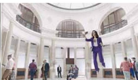
Neben mehreren Tausend Plakaten, Radiospots, Printanzeigen und natürlich auch Online-Werbung gibt es zum neuen Produkt auch einen Spot.