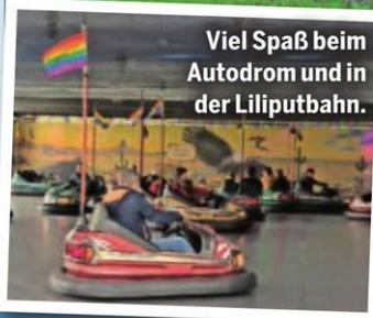
Viel Spaß beim Autodrom und in der Liliputbahn.