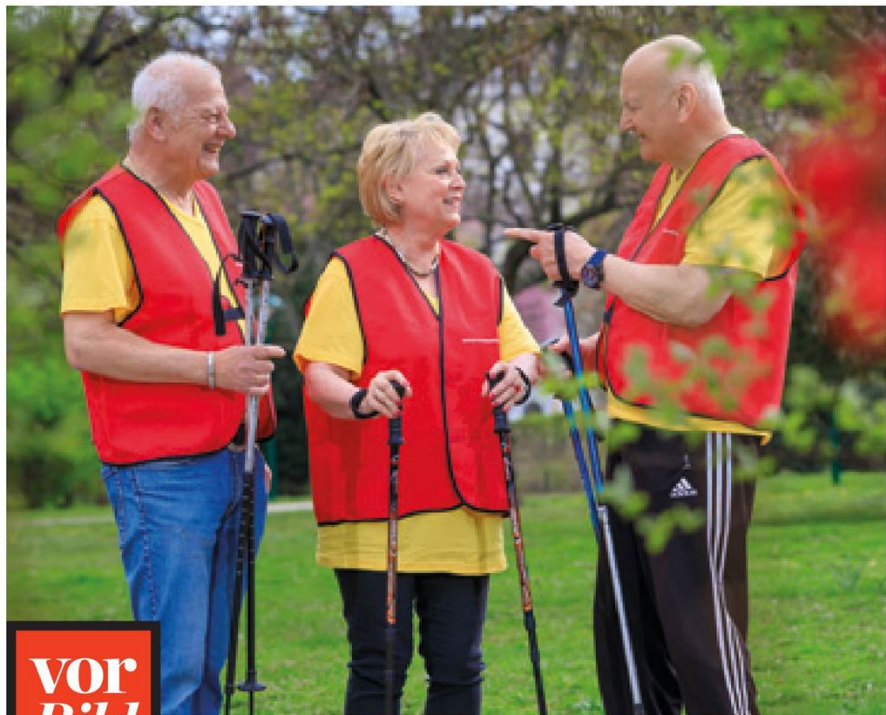
WERBUNG; Foto: Pensionistenklubs der Stadt Wien/Schedl

AKTION. An jedem Dienstag in den Wiener Sommerferien gilt die Rabattaktion „Prater Diensttage“: Bei der Bezahlung mit der Pratercard gibt es minus 20 Prozent auf den Fahrpreis bei allen Pratercard-Attraktionen. Alle Infos dazu gibt es im Web unter pratercard.at