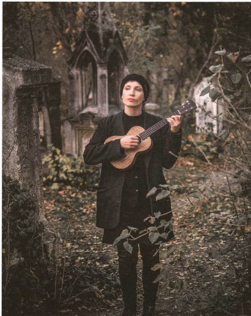
Sigrid Horn ist am Sonntag um 18.30 Uhr auf der Jura-Soyfer-Bühne zu erleben

Beim Popfest haben Sie kürzlich ein berührendes Lied gespielt, das zur Goldenen Hochzeit Ihrer Großeltern entstanden ist. Sind Sie auch für andere Auftragsarbeiten zu haben?