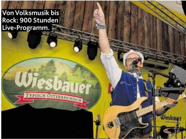
Von Volksmusik bis Rock: 900 Stunden Live-Programm.