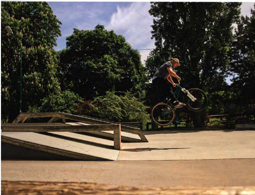
Der Skatepark (in Richtung Lusthaus wandernd auf der rechten Seite)