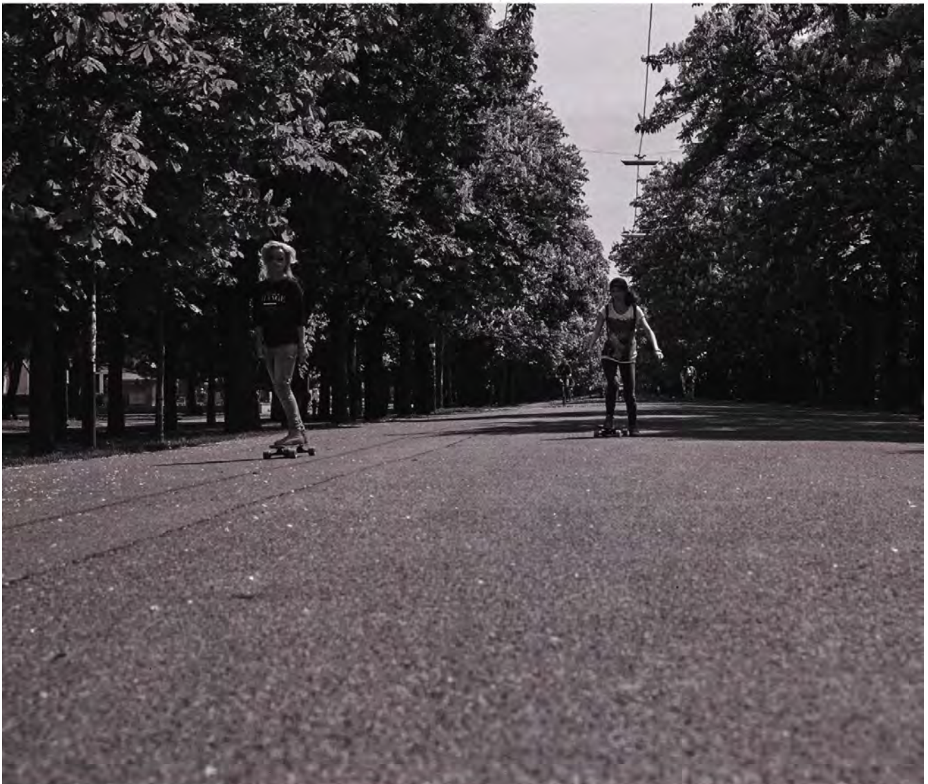
Die Hauptalle ist wahrscheinlich das größte Sportgerät Wiens – hier wird gelaufen, geradelt, geskattet, gewalkt und im Winter – bei Neuschnee – sogar langgelaufen.