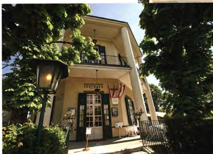
Das Lusthaus wurde zwischen 1781 bis 1783 erbaut und schließt die Hauptallee auf der einen Seite ab. Wer weiter geht, kommt zu den Pferden in die Freudenu und zum Golfplatz.