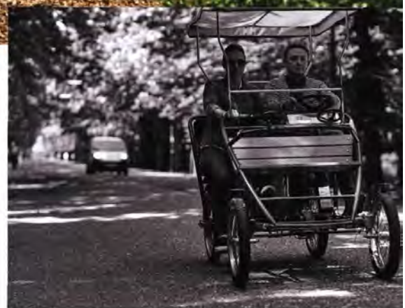
Erinnerungen an Bibione, Lignano & Jesolo in den 70er-Jahren ...

Dabei ist die Hauptallee inzwischen fast unglaubliche 500 Jahre alt. 1538 wurde sie durch Schlägerungen im Auwald angelegt, um eine Verbindung zwischen dem Augarten und dem kaiserlichen Jagdgebiet im Prater herzustellen. Am 7. April 1766 gab Kaiser Joseph II. als Mitregent Maria Theresias den Prater zur allgemeinen Benutzung frei. Und die Wienerinnen und Wiener kamen in Scharen, bekanntlich gab es hier bald zahlreiche Kaffeehäuser, Ausstellungen und Belustigungen. Unweit der Hauptallee befindet sich das größte Stadion Österreichs – das Ernst-Happel-Stadion – und das beliebte Stadionbad. Auch ein kleiner Fußballplatz, Tennisplätze sowie