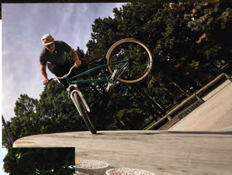
Äktschn muss auch sein!