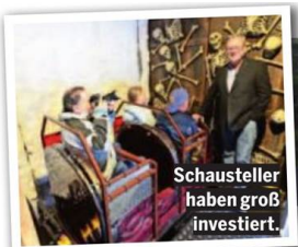
Schausteller haben groß investiert.