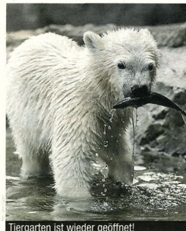
Tiergarten ist wieder geöffnet!