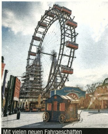
Mit vielen neuen Fahrgeschäften