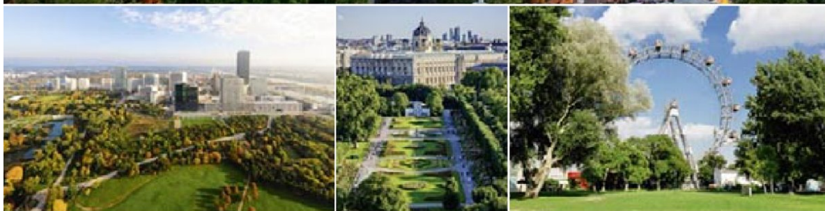
Naturliebhaber kommen in der österreichischen Hauptstadt voll auf ihre Kosten. Nicht umsonst wurde Wien heuer zur grünsten Stadt der Welt gekürt.

Von Haydn, Mozart und Beethoven zu Falco, Reinhard Fendrich und Billy Joel – bis heute inspiriert Wien mit seinem einzigartigen Flair Musiker aus aller Welt. Kein Wunder, denn mit Anbruch der Dämmerung verwandelt sich die Stadt in ein atemberaubendes Lichtermeer, daher die berechnete Frage: Haben Sie Wien schon bei Nacht geseh'n?