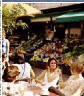
Fotos: Wien Tourismus/Peter Rissold (1), Café Central, Wien/Fotograf Herbert Lehmann (1), Café Central, Wien/Fotograf Herbert Lehmann (1), Steirerck © pieranes / Architekt PPAG architects (1)