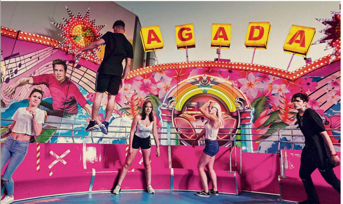
Man sieht sofort, wer öfter auf dem Tagada mitfährt und wer nicht. Das soll man auch sehen: Es ist eine wirbelnde Bühne.