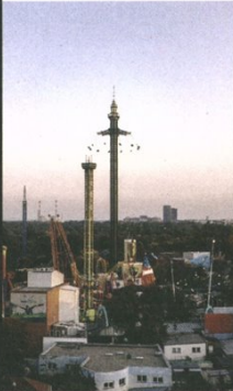
Jahrmarkt-Feeling im Wiener Prater