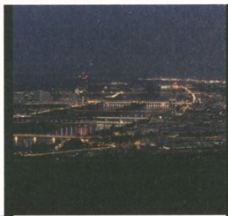
Die Stadt zu Füßen: Blick vom Kahlenberg auf Wien

Fans von bunter Beleuchtung sind auch im Wiener Prater gut aufgehoben. Viele der Attraktionen haben bis spät in der Nacht geöffnet und können im Vorbeigehen bewundert werden. Den Sonnenuntergang kann man am besten vom Wiener Riesenrad aus genießen, bei dem es ab 21. November sogar einen Wintermarkt gibt. Ansonsten haben im Winter aber viele Attraktionen geschlossen und der Prater bekommt etwas von einem „Lost Place“, der sich ideal für einen ruhigen Nachtspaziergang eignet.