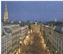
Die schönen Fassaden kommen bei Nacht noch besser zur Geltung

Untertags noch von Menschen überlaufen, lassen sich die Gassen und Innenhöfe des ersten Bezirks bei Nacht in Ruhe bewundern. Ein guter Startpunkt ist die prunkvoll beleuchtete Staatsoper, von der aus man zum Stephansdom und weiter über die Rotenturmstraße Richtung Schwedenplatz schlendert. Besonders schön ist der Weg durch die Jesuiten- und Schönlaterngasse. Am Schwedenplatz angekommen, belohnt die Aussicht auf den Donaukanal und seine bunt beleuchteten Brücken.