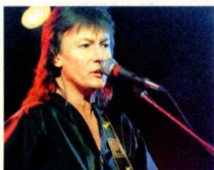
Chris Norman gibt ab 21 Uhr auf der Kaiserwiese den Ton an

schener Gewerkschafter, der SJ Wien, der Naturfreunde u. v. m. Gesponsert von AKM, der Bank Austria Creditanstalt, der Brau Union Österreich AG, dem Casino Admiral Prater, den Österreichischen Lotterien, der Österreichischen Elektrizitätswirtschafts-AG, dem Wiener Praterverband, der Wiener Städtischen Versicherung und „PlayStation 2“