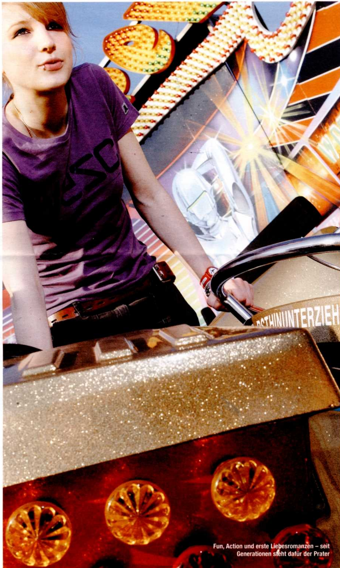
Fun, Action und erste Liebesromanzen – seit Generationen steht dafür der Prater

TEXT ELISABETH HEWSON / FOTOS LUKAS ILGNER