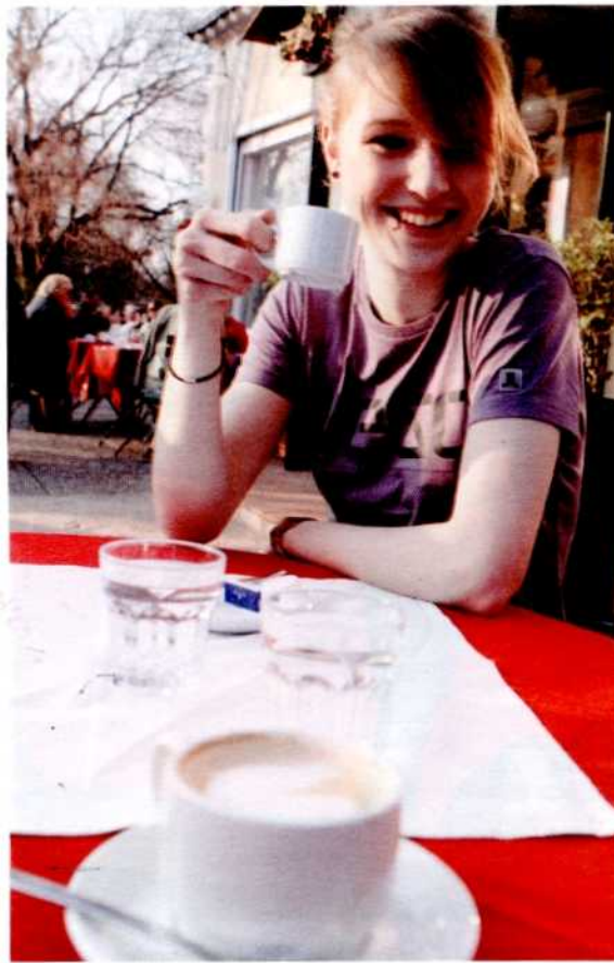
Café Meierei: renoviertes k. u. k. Relikt – Wiener Melange

Man will mehr „Familienfahrergeschäfte“ anbieten, bei denen keiner warten und zuschauen muss, sondern alle, vom Enkel bis zur Großmama, miteinander fahren, schweben oder kreiseln können. Man will Info-Stände bauen, mehr Toilettenanlagen (in die man sich hoffentlich hineintraut), die Fressbuden verringern und dafür bessere Wirtshäuser und Restaurants ansässig machen. Mehr Kultur soll dort wieder stattfinden,