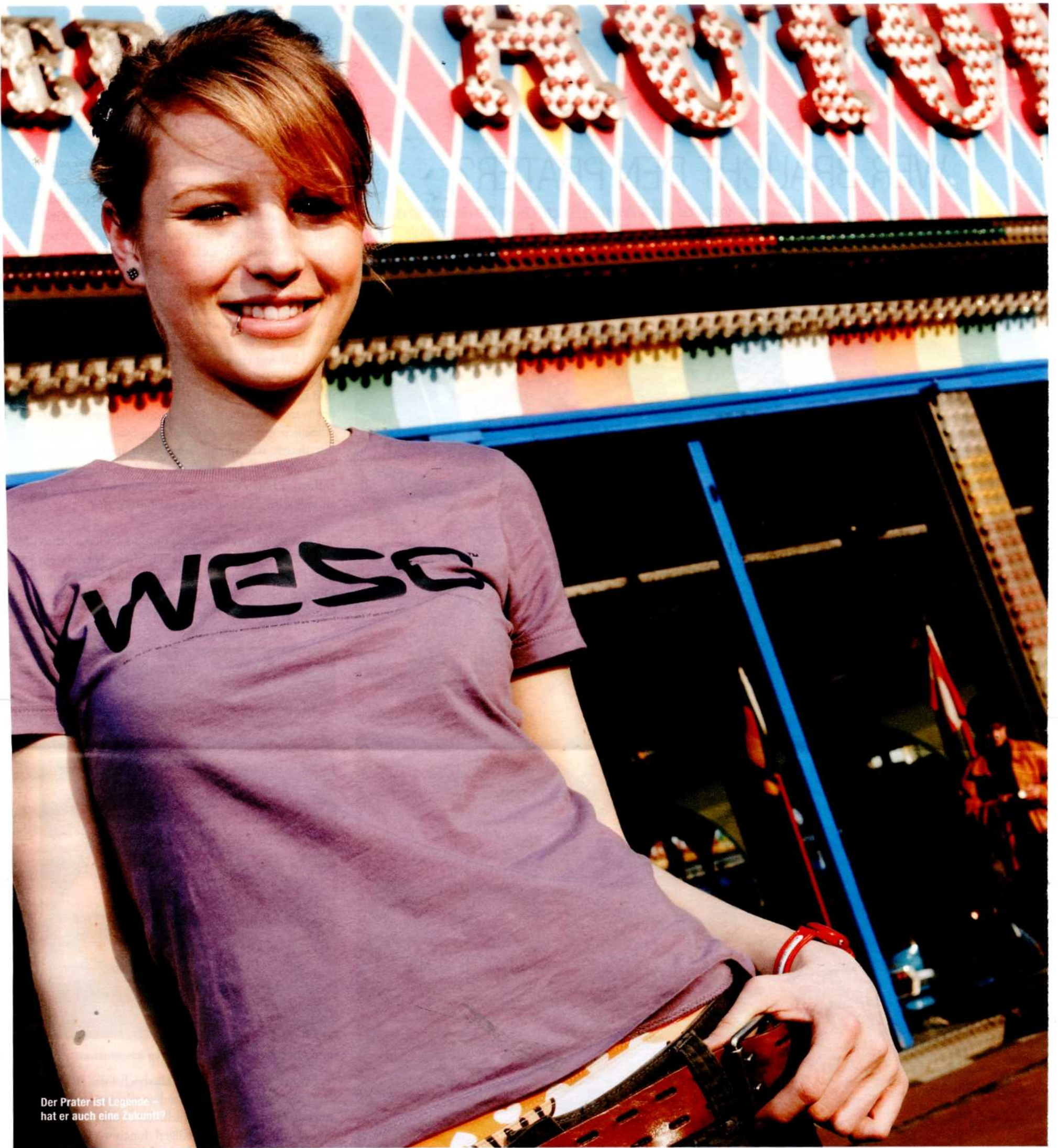
Der Prater ist Legende – hat er auch eine Zukunft?