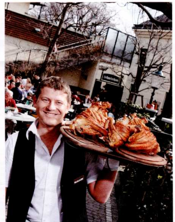
Für viele das Beste am Prater: Stelzen im Schweizerhaus

AUS EINEM STRENG bewachten umzäunten kaiserlichen Jagdgebiet wurde unter Kaiserin Maria Theresia ein Park für Adelige und unter ihrem Sohn Josef II. einer fürs „gemeine Volk“. Die Wiener stürmten ihr neues Erholungsgebiet, 1775 wurden die Bretterzäune nie-