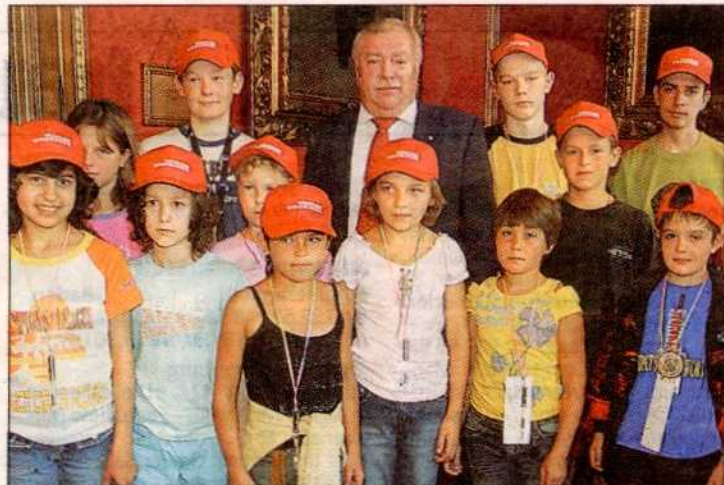
Wiens Bürgermeister Häupl empfing die Kinder im Rathaus