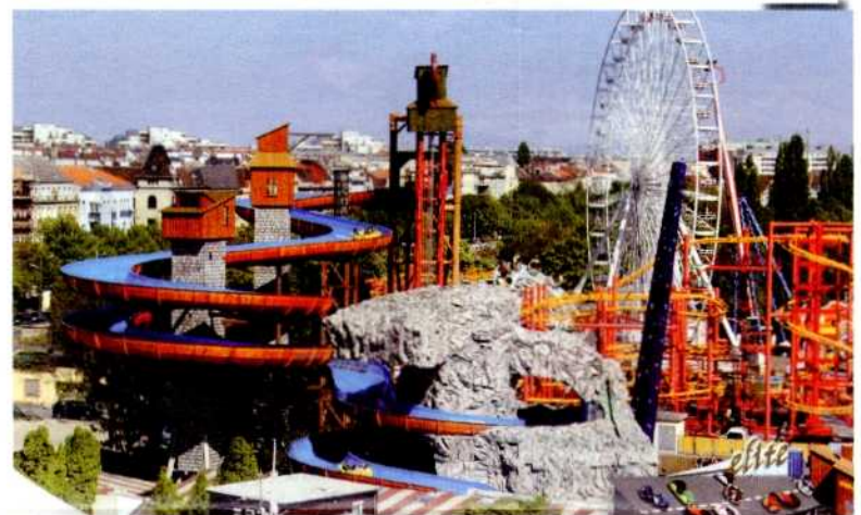
Der Wiener Prater lockt in diesem Sommer mit atemberaubenden Fahrerlebnissen.

Ursprünglich war der Prater nichts weiter als ein malerischer Landstrich im Augebiet – aber einer, zu dem es die Bevölkerung immer schon magisch hingezogen hat. 1538 wandelten die WienerInnen bereits entlang der damals frisch gepflanzten und heute prachtvollen Kastanienallee, und genossen die Natur pur. 25 Jahre später wurde dieser Lustbarkeit allerdings ein Riegel vorgeschoben, denn der Kaiser wünschte dort ungestört zu jagen. Es dauerte mehr als 200 Jahre, bis die WienerInnen ihren geliebten Prater wieder zurückbekommen haben. Der Prater erhielt Kaffehäuser, man spielte Musik und schon bald folgten Attraktionen, die das Pratervergnügen immer weiter vergrößerten: Der Wurstelprater war geboren. Heute locken eine einzigartige Mischung